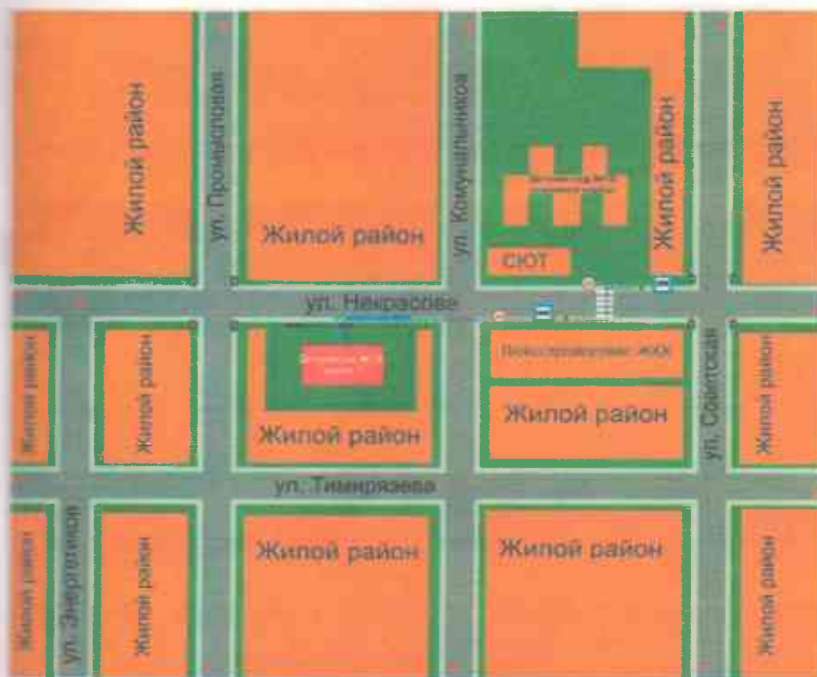
Схема организации движения в непосредственной близости от образовательного движения с размещением соответствующих технических средств, маршруты детей